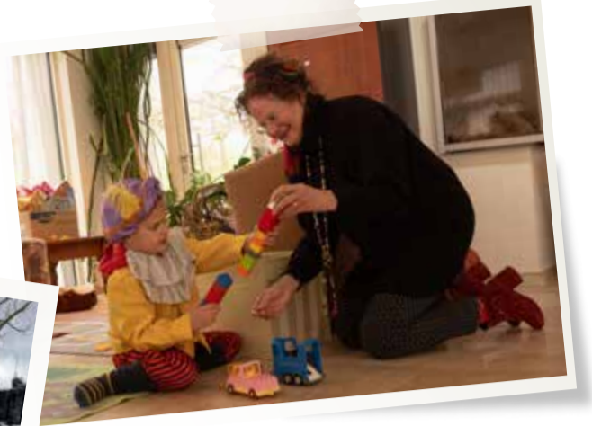
Maart - Speelruimte voor Oekraïense kinderen in Schin op Geul