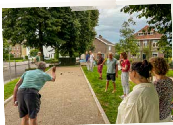
Augustus - Jeu de boules Sibbe