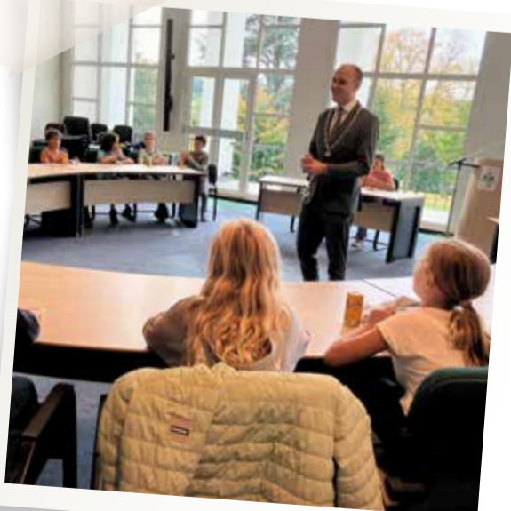
Oktober - Bezoek OBS Berg aan het gemeentehuis