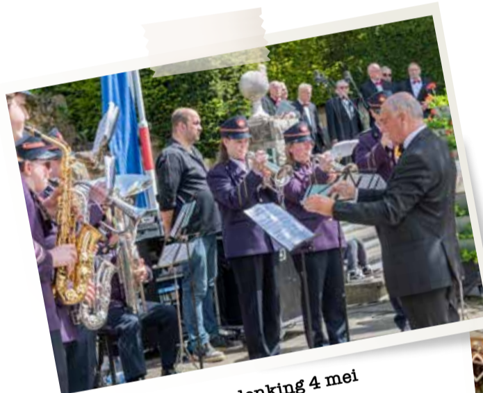
Mei - Nationale herdenking 4 mei