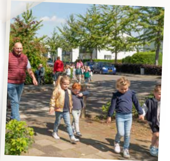
Juni - Kleutervierdaagse