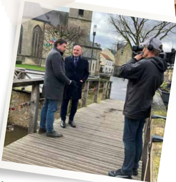
Februari - Opname tv programma Pointer over wateroverlast