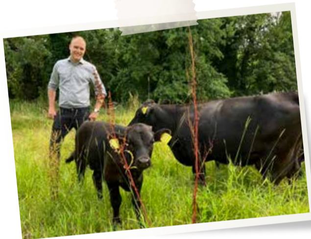
Juli - Dexterkoeien als natuurlijke grazers bij de waterbuffer Beatrixsingel