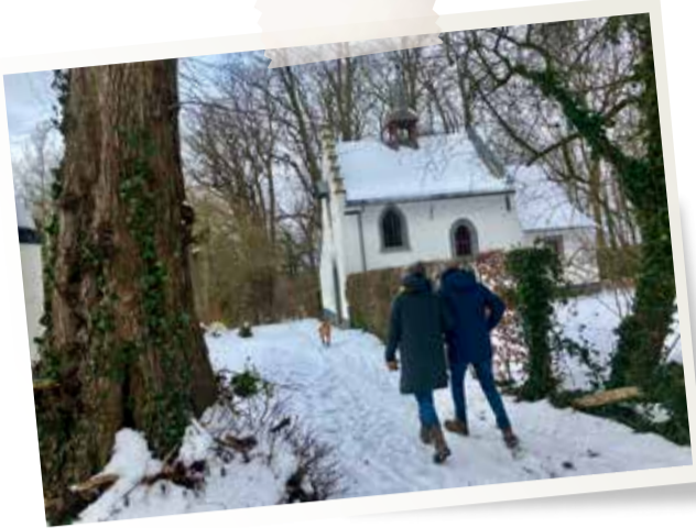
Januari - Een pak sneeuw bij de Kluis