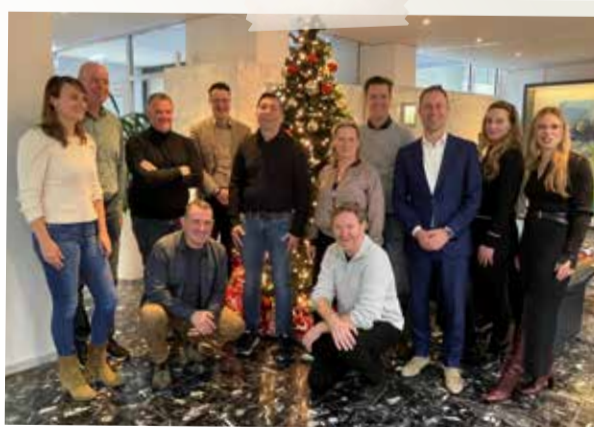
November - Verkiezingen BIZ Valkenburg