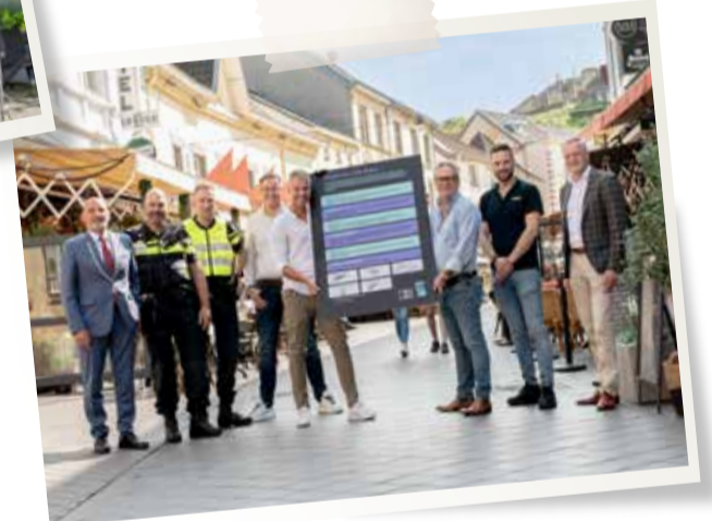
September - Start campagne Veilig uitgaan