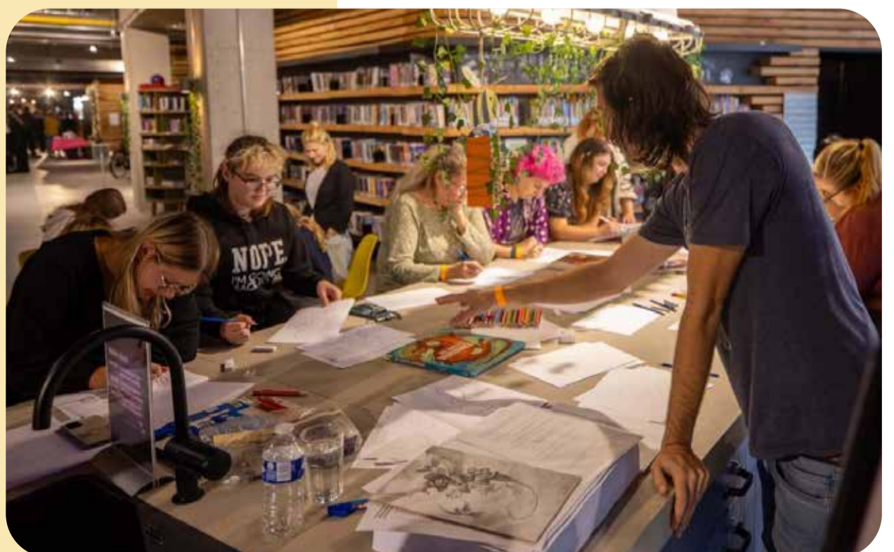
Fotobijschrift: een sfeerimpressie van de HUB in Kerkrade