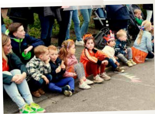
April - Koningsdag