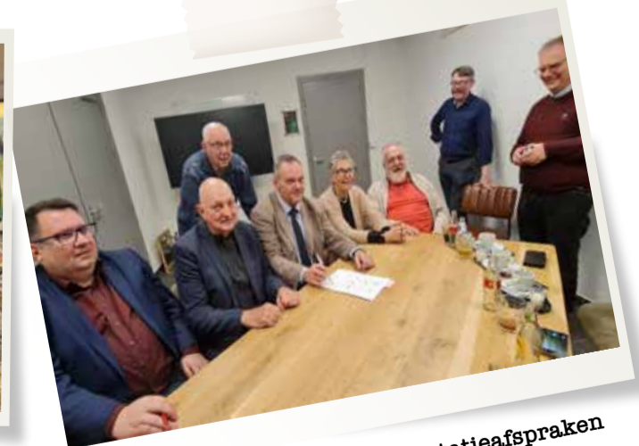
December - Ondertekening prestatieafspraken met woningcorporaties